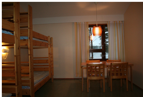
neljän hengen huone